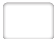
030 Bianco Tinting PMS