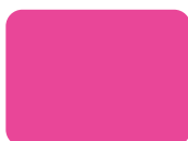
139 Fluo Magenta