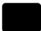
010 Nero Tinting PMS