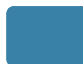
277 Blu Chiaro PMS