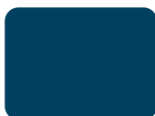
230 Blu Scuro PMS