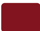
162 Rosso Scarlatto PMS