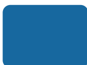
205 Blu Medio PMS