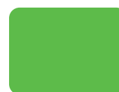
312 Fluo Verde