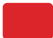
124 Rosso PMS