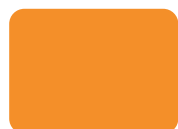
105 Fluo Arancio