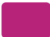
154 Fucsia PMS