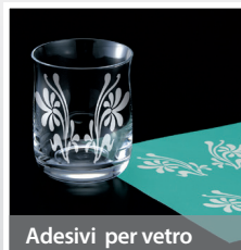
Adesivi per vetro